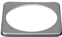
BMV bezel square