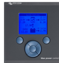
Tableau Blue Power

Kit de câble requis pour connecter le BMV et le Contrôle à distance Victron. Connexion des données BMV incluse.