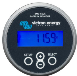
BMV 602S Black

Adaptateur non nécessaire Remarque : les connecteurs RJ45 sont isolés de manière galvanique du contrôleur et du shunt.