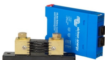
VE.Net Battery Controller